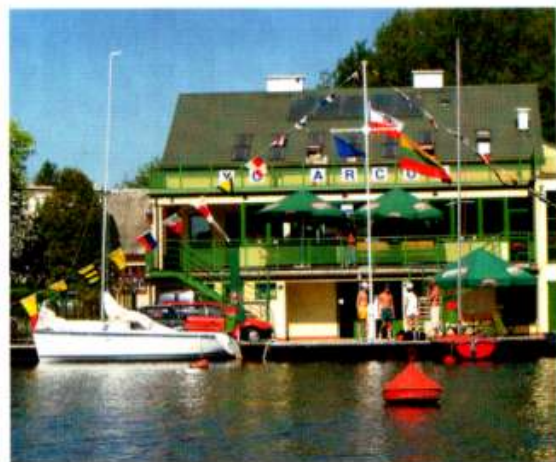
Nowy, w pełni dostosowany budynek YC ARCUS. Tarasy wokół budynku umożliwiają rozkoszowanie się widokami na Jezioro Rajgrodzkie.

Realizacja rocznego projektu „Z wiatrem pod wiatr” dobiegła końca. Kilku osobom udało się uzyskać patenty żeglarskie, natomiast dla pozostałych uczestników była to z pewnością niezapomniana przygoda z wiatrem i wodą w roli głównej. W trakcie regat młodzi żeglarze z wielką determinacją walczyli o każdy metr na wodzie, a sportowy duch walki udzielał się również opiekunom i instruktorom. Czy z młodego narybku wyrosną kolejni utytułowani zawodnicy lub zapaleni turyści wodni – czas pokaże. Na wszystkich czekają liczne ośrodki żeglarskie usytuowane w różnych częściach kraju. Tak jak Arcus coraz szerzej otwierają swe podwoje, uwzględniając w przedstawianej ofercie potrzeby żeglarzy niepełnosprawnych. Ci, którzy już posmakowali wiatru oraz wody, twierdzą, że wy-